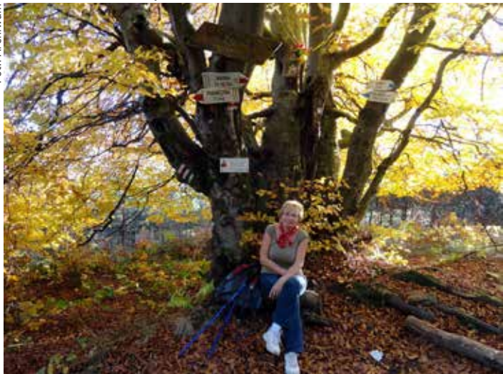
Obidza w Beskidzie Sąddeckim

To chyba najtrudniejsze.. Z pewnością ambitna, obowiązkowa, bezkonfliktowa a przy tym bardzo nieśmiała. To dlatego nie lubię publicznie zabierać głosu, występować w mediach, ani udzielać wywiadów! Niestety, życie ciągle „rzuci mi jakieś kłody pod nogi”... A poza tym zupełnie przeciętna... ■