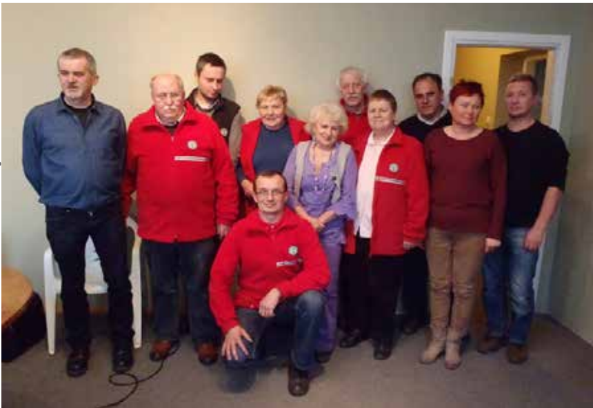
Uczestnicy posiedzenia Prezydium ZG PTT