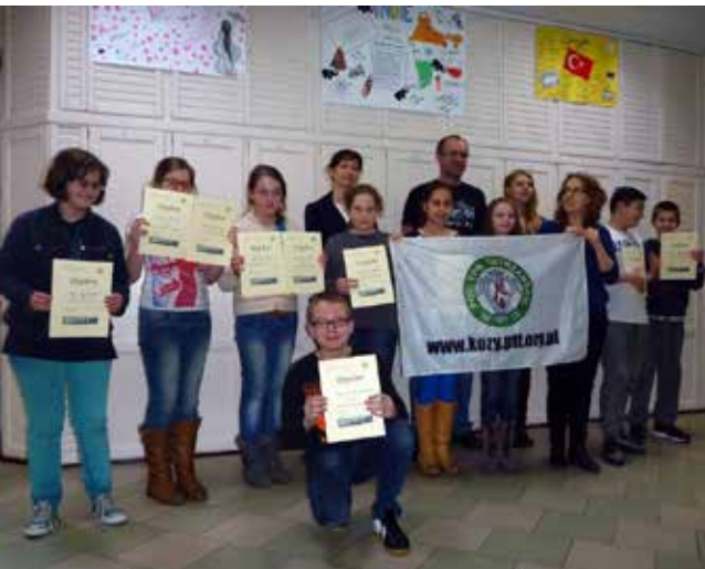
Uczestnicy konkursu na pamiątkowym zdjęciu