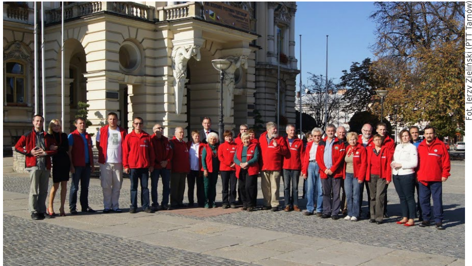
Pamiątkowe zdjęcie pod nowosądeckim Ratuszem

W trakcie posiedzenia odwiedził nas – na zaproszenie Komisji ds. Ochrony Przyrody i Zabytków przy ZG PTT – Poseł na Sejm RP, Arkadiusz Mularczyk. Pan poseł przedstawił nam swoją opinię na temat planów sprzedaży Polskich Kolei Linowych oraz wysłuchał informacji o naszym stanowisku i dotychczasowych działaniach w tej sprawie. Dyskutowaliśmy także o możliwych dalszych