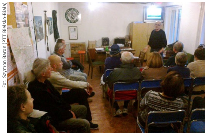
Prelekcja o Parku Narodowym Gór Stołowych

Prelekcja spotkała się z dużym zainteresowaniem wszystkich obecnych na spotkaniu. Oprócz członków naszego oddziału w spotkaniu wzięli udział sympatycy PTT i przedstawiciele młodzieży szkolnej. Wielu z nas nie przypuszczało, że tak rzadkie i piękne okazy ptaków i motyli występują w naszym regionie. ■