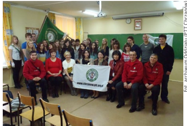
Uczestnicy zebrania założycielskiego